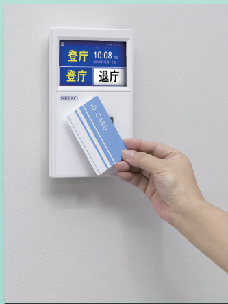
壁掛設置イメージ