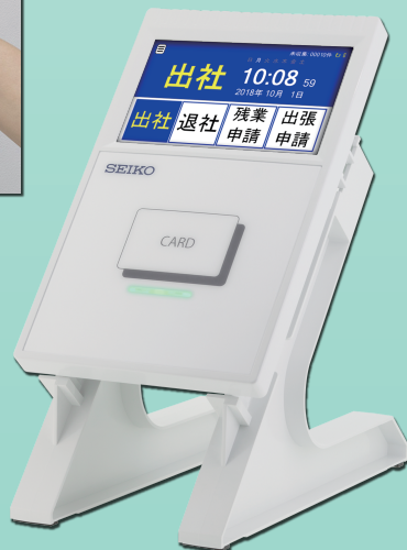
(専用スタンドは別売)