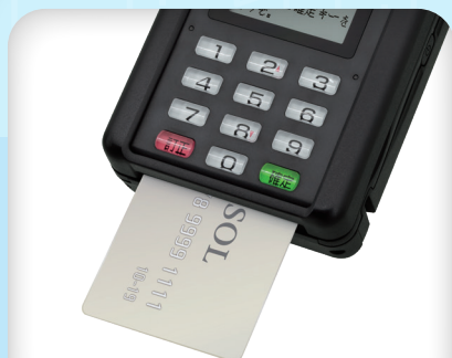
接触ICクレジットカード使用时