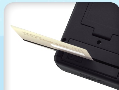
磁気クレジットカード使用时