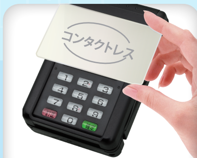
電子マネー&コンタクトレス クレジットカード使用时